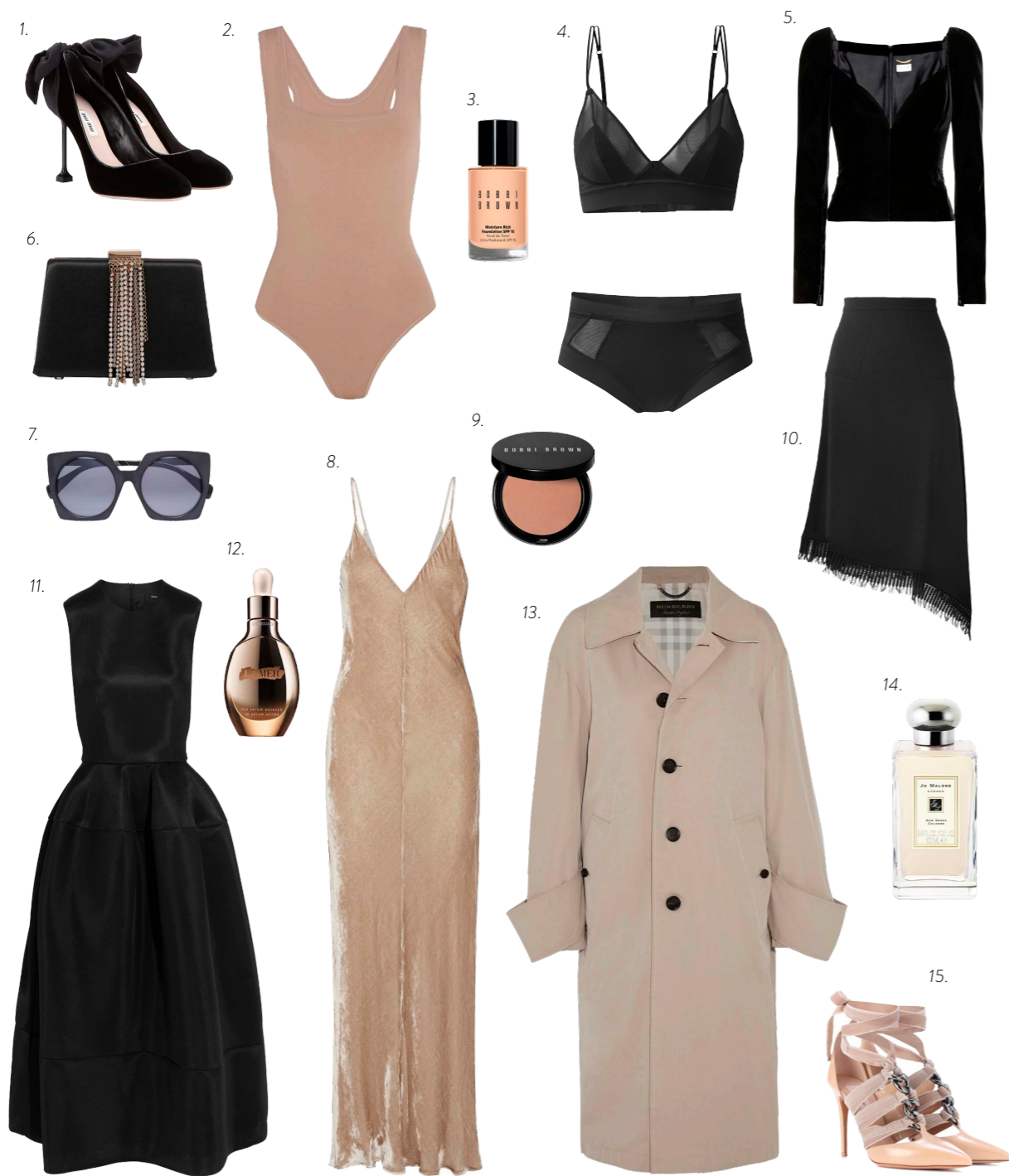
1. MIU MIU 2. ALAIA 3. BOBBI BROWN MOISTURE RICH FOUNDATION 4. H&M STUDIO 5. SAINT LAURENT 6. LANVIN 7. YOHJI YAMAMOTO PREDÁVA ŽILKA OPTIK STUDIO 8. JUAN CARLOS OBANDO 9. BOBBI BROWN ILLUMINATING BRONZING POWDER 10. ROLAND MOURET 11. SIMONE ROCHA 12. LA MER GENAISSANCE DE LA MER SERUM 13. BURBERRY 14. JO MALONE RED ROSES COLOGNE 15. VALENTINO

Vaše obľúbené dizajnérske značky o 30-70% lacnejšie